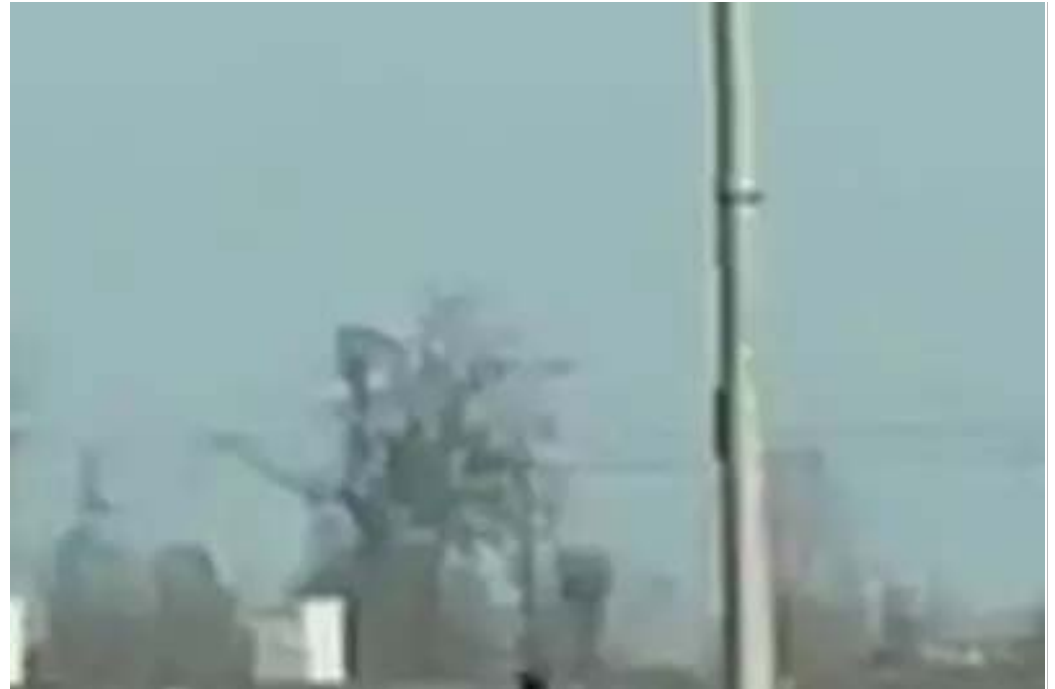
Market della droga sotto casa «Assediati da pusher e clienti» La Provincia Pavese - Pavia