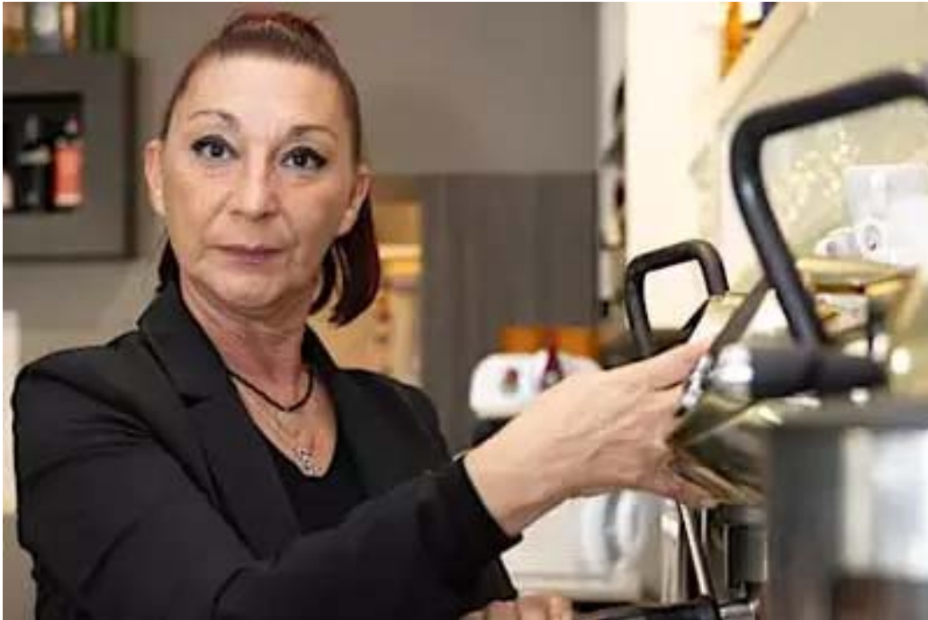
Stradella, la tazzina del caffè passa a 1,40 euro: «Troppe spese, costretti all'aumento» La Provincia Pavese - Pavia